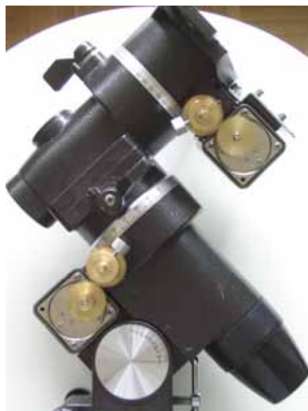
Beide Motoren angebaut

Wer etwas Geschick und das notwendige Werkzeug besitzt, kann dies mit entsprechendem Zeitaufwand selber tun, anderen ist externe Hilfe einer mechanischen Werkstätte zu empfehlen. Im Folgenden beschreibe ich meine Lösung, die ich umgesetzt habe und die (zumindest bis heute) gut funktioniert. Nach der Montage der beiden Nachführ-Motoren sieht die Montierung so aus: